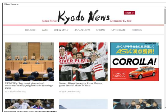
Kyodonews.net 共同通信社運営の英文ニュースサイト